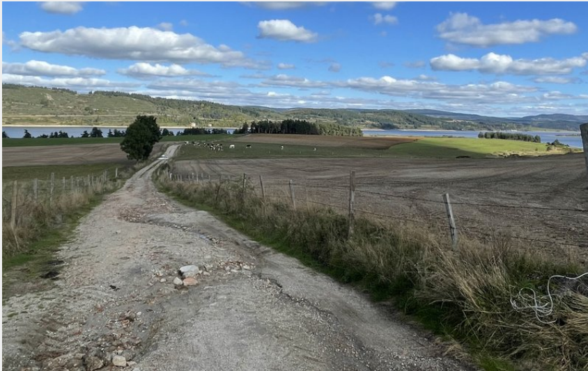
Large descent vers le lac