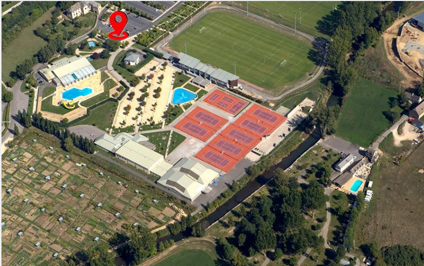
Départ des sentiers VTT (Mairie de Mende)