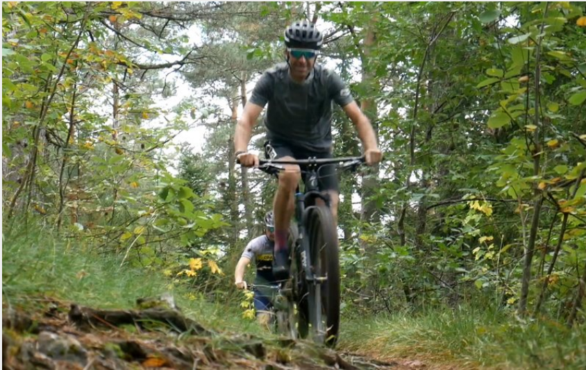
VTT à Mende