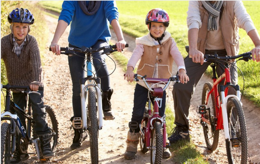
VTT en famille sur le Causse de Mende