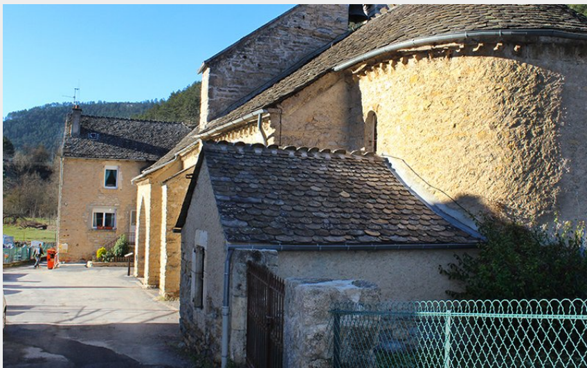
Eglise de Balsièges