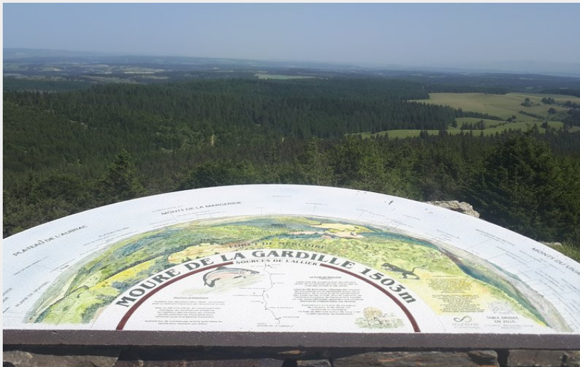
Table d'orientation du Moure de la Gardille, sommet de Lozère (TouN)