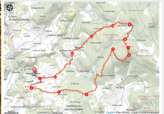
Le truc du Chapelat