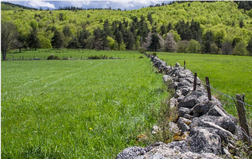
La Margeride