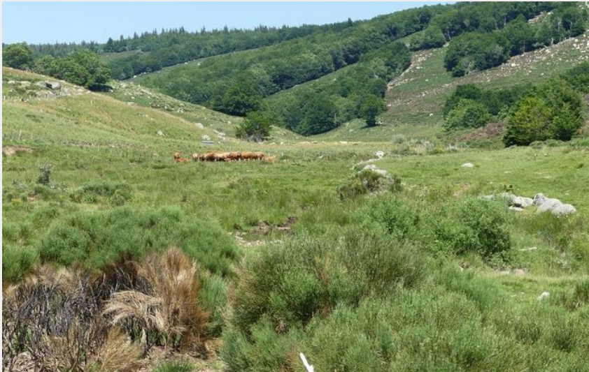
Troupeau au dessus de Gourdouze (nathalie.thomas)