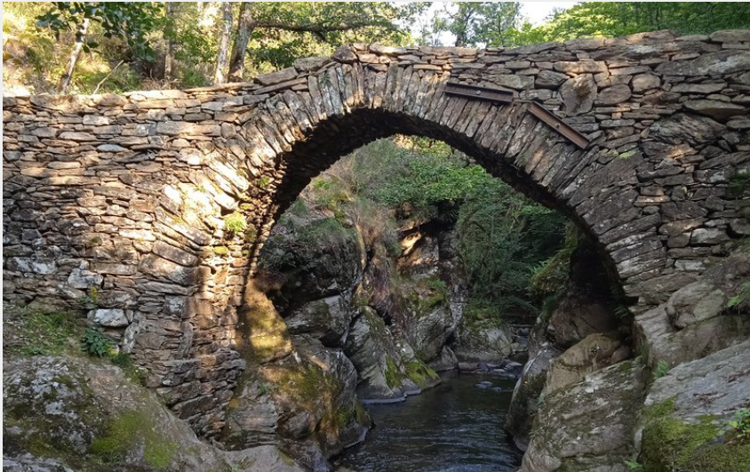
Pont de Mesclon (OTAGDT)