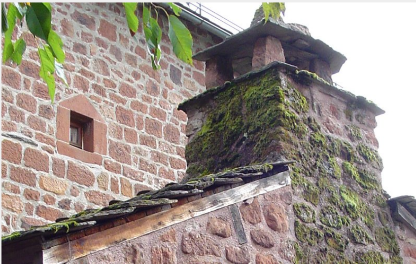
Cheminée en grès rouge