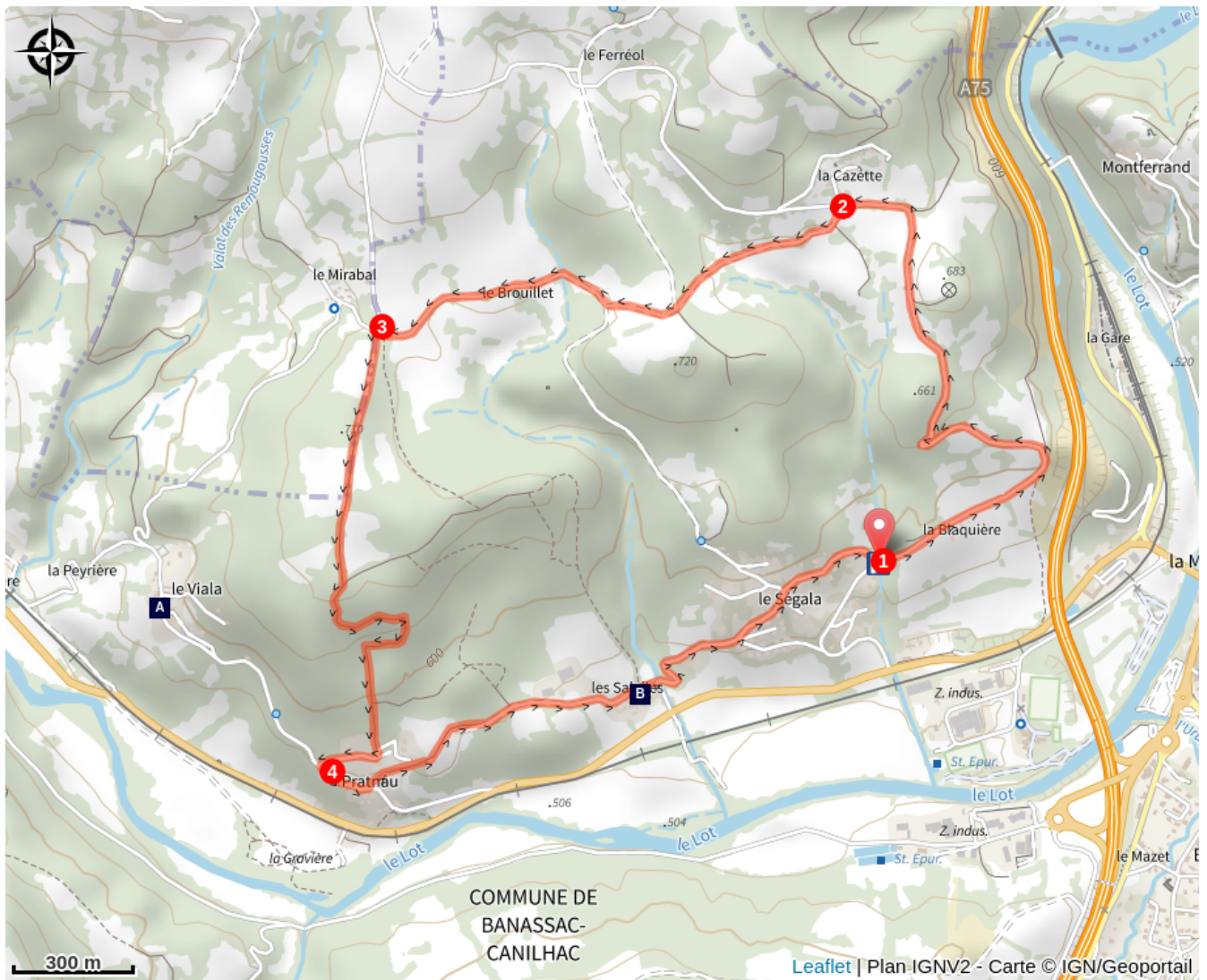
Eglise Saint-Antoine (A)