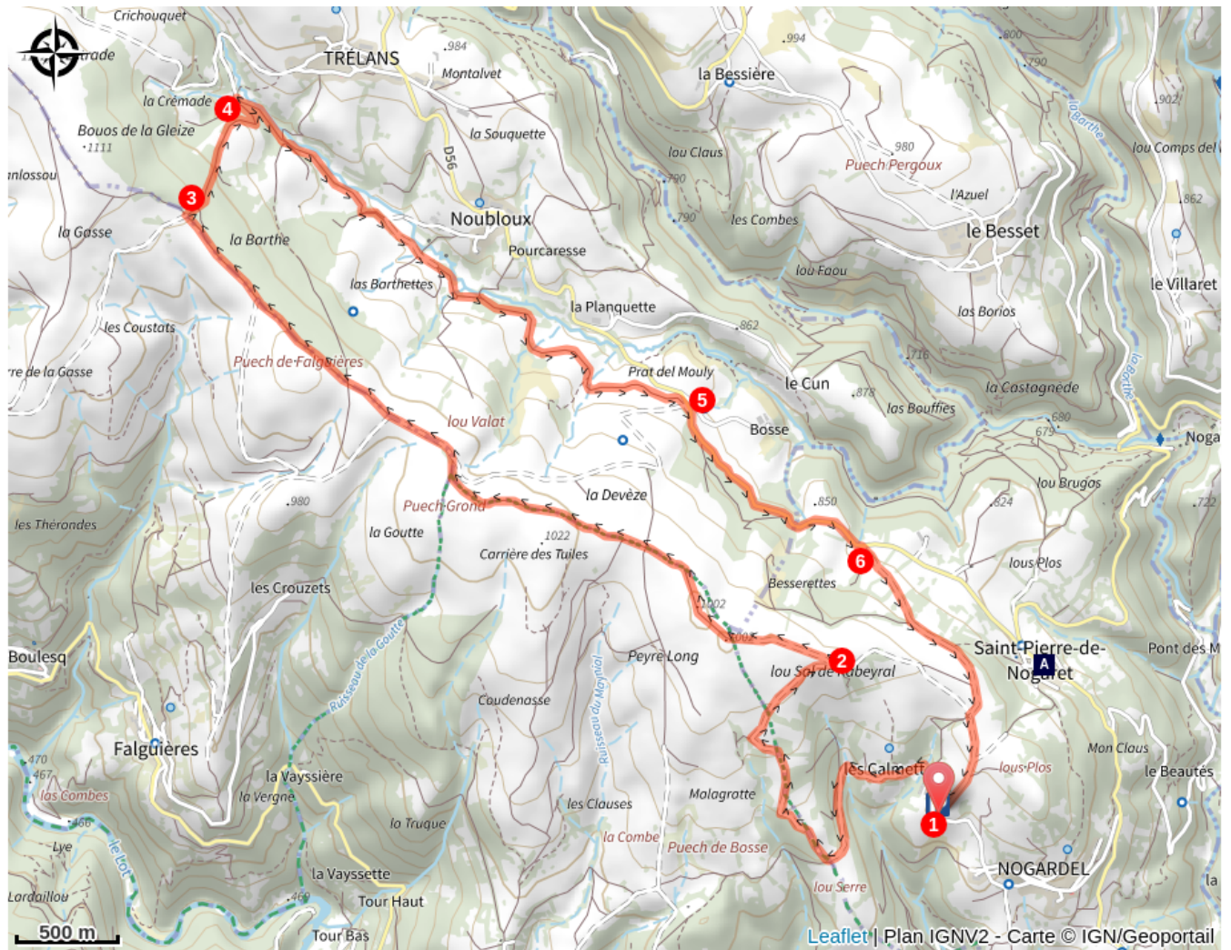
Eglise Romane de St Pierre de Nogaret (A)