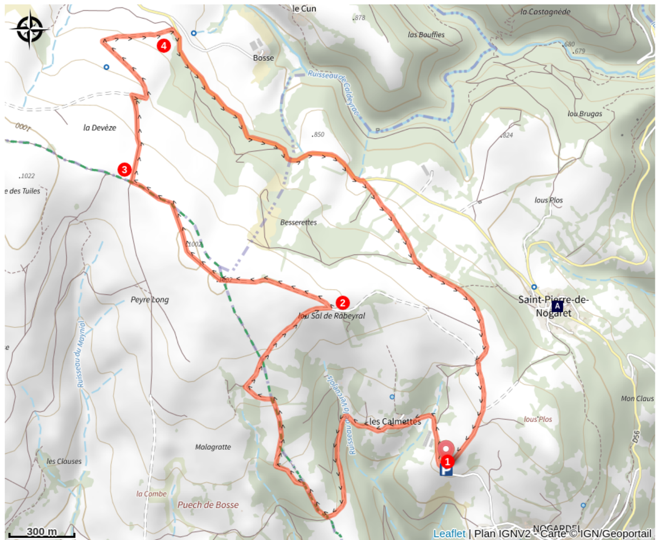
Eglise Romane de St Pierre de Nogaret (A)