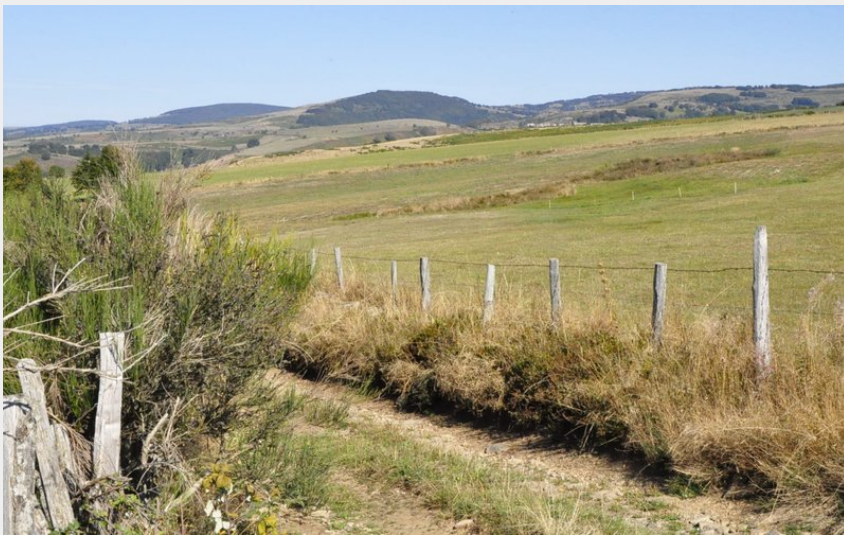
Les monts d'Aubrac depuis le chemin de crête