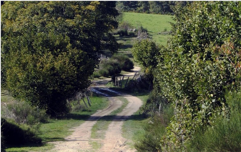
Piste en Margeride