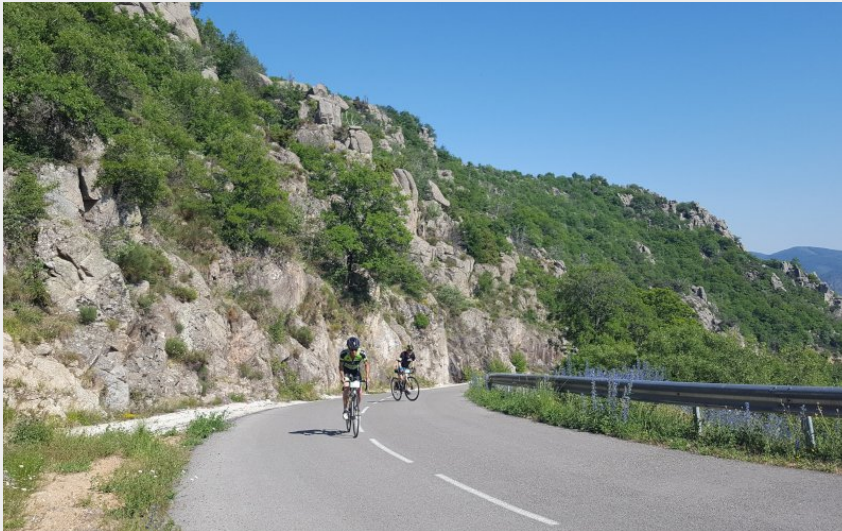
Boucle cyclo du Tour du Finiels