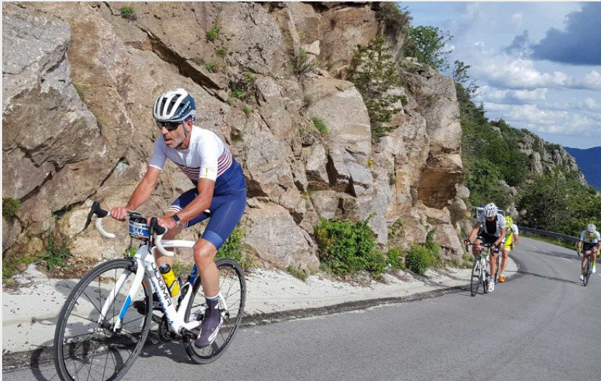
Boucle cyclo du Tour du Pic Cassini