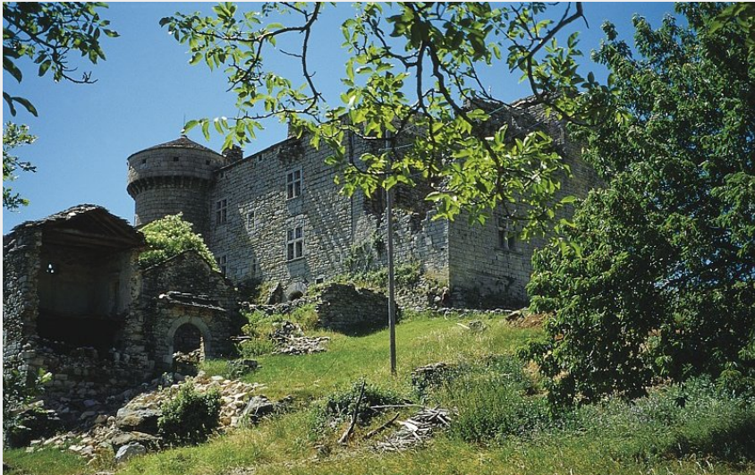
Château du Cheylard (Rémi Noël)