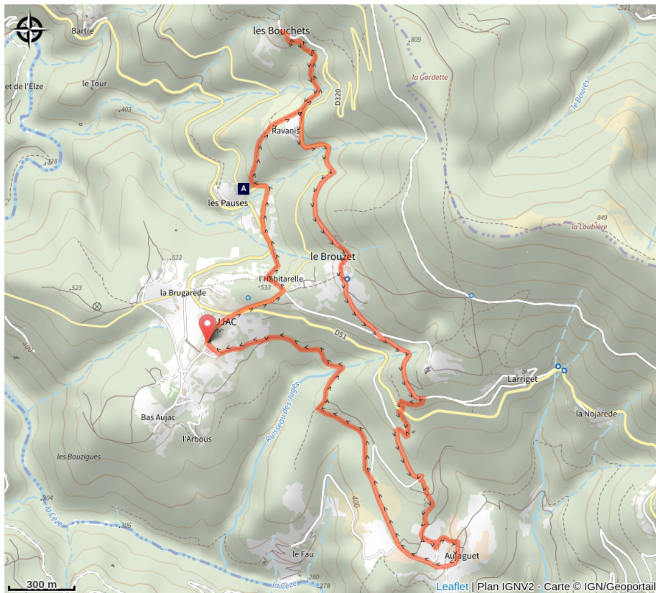
Le hameau des Pauses (A)