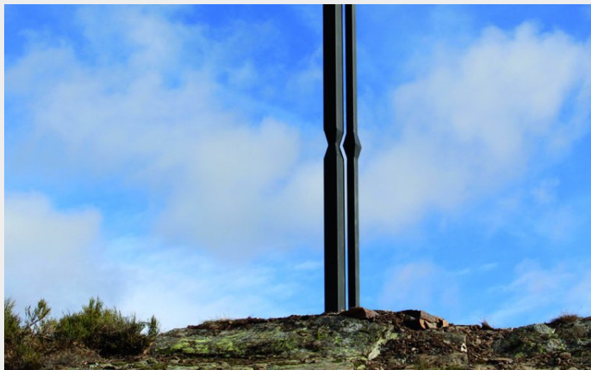
Sculpture d'art contemporain sur le chemin Sculptures en liberté (Association Sculptures en liberté)